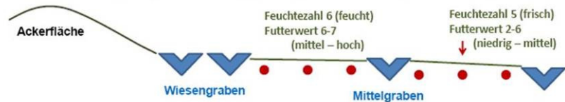
Abb. 2: Ergebnis der Vegetationsaufnahme einer intensiv genutzten Mähweide mit ausgeprägtem Mikrorelief (J. Dzialek, Humboldt-Universität zu Berlin)