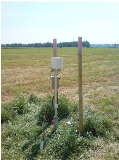
Abb. 3: Installierter Datalogger zur Grundwasser- und Niederschlagsmessung im Teilprojekt HYDBOS

Insgesamt kooperieren zwölf landwirtschaftliche Betriebe unterschiedlicher Flächengröße (100 bis 1600 ha Grünland) mit HYDBOS. Anfang