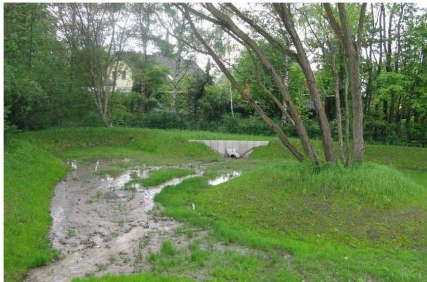
Regenrückhaltebecken Panketal, Bernauer Straße